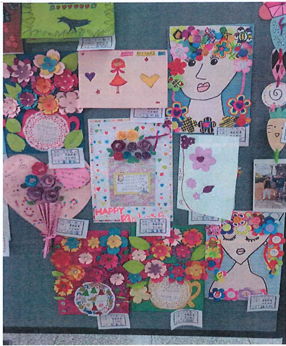
說明：孝親創意卡片設計