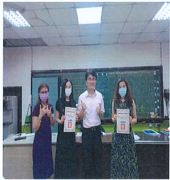
說明：校長和主任頒獎給指導學 生參加全市孝親月創意卡片得獎 的教師