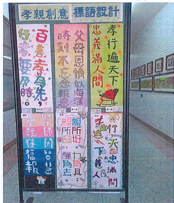
說明：孝親創意標語設計