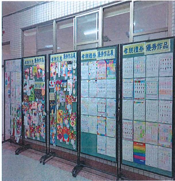
說明：全國孝親月活動