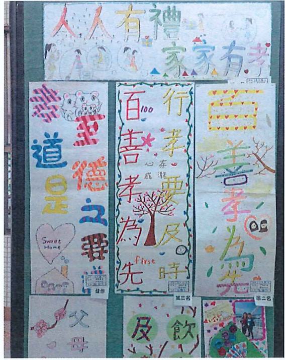
說明：全國孝親月活動