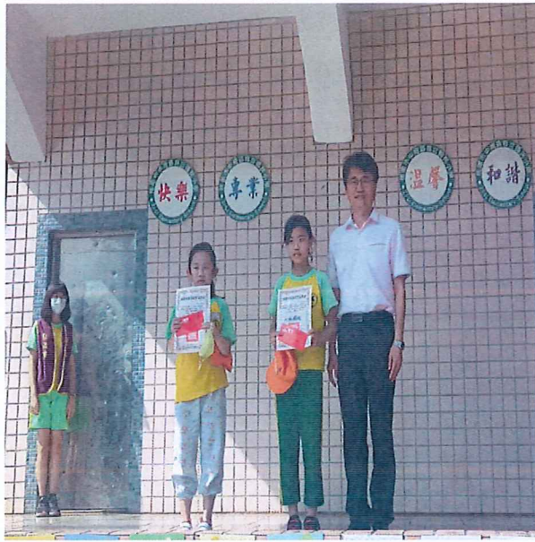
說明：校長頒獎給參加全市孝親月 創意卡片得獎的學生