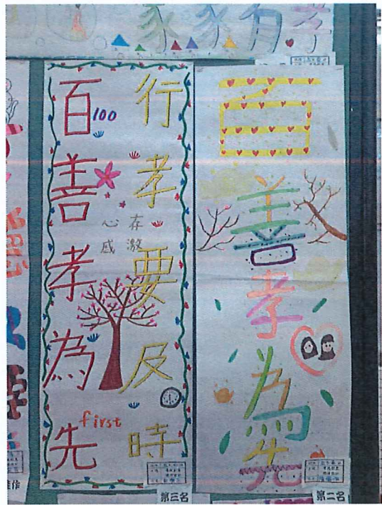
說明：孝親創意標語設計