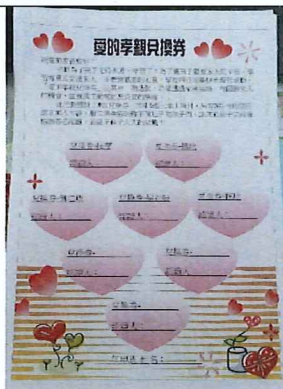
說明：愛的孝親券，孩子在家協助完成孝親任務