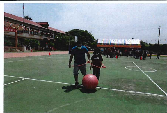
說明：親子合力踢球