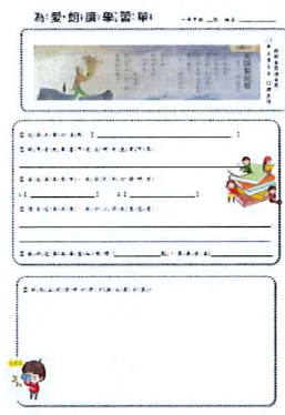
說明:為愛朗讀，各年級完成各自 朗讀任務