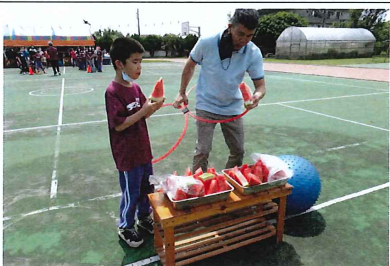
說明：到指定位置享用西瓜