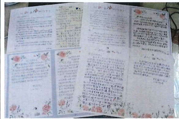
說明：五年級全班認真寫信給家人