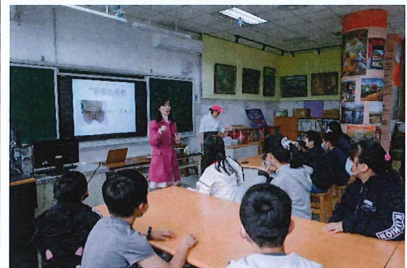
說明：愛的手做點心