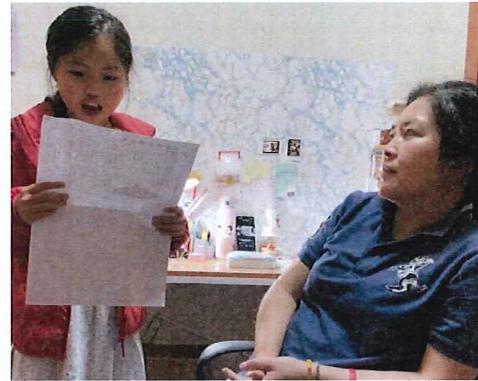
說明:孩子在家朗讀一篇文章給家 人聽