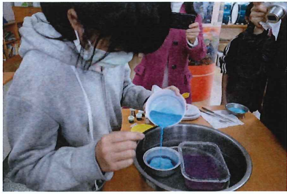
說明:九層糕分層調色，一層一層 倒入蒸煮