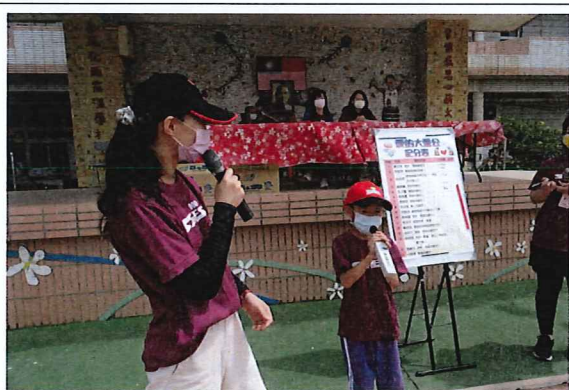
說明：學生大聲喊出對家人的愛