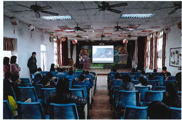
說明：於全校好書介紹時間進行