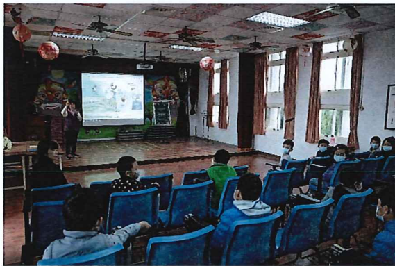
說明：透過故事中主角互動，感受與家人的感情。