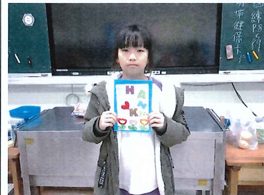
說明：獨一無二的孝親卡完成了