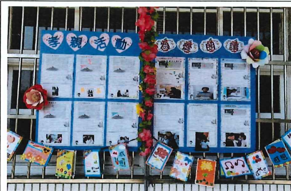
說明：於校慶中展示為愛朗讀成果