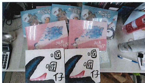
說明：採購家庭教育相關繪本