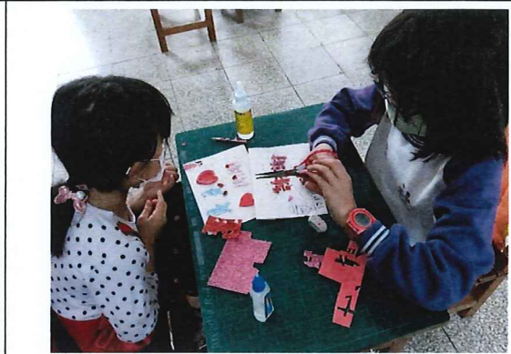
說明：學生認真製作孝親卡