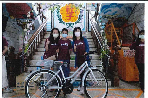
說明：抽出最大獎腳踏車獲獎者