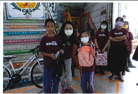
說明：抽出後背包獲獎者