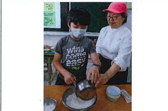
說明：六年級學習製作客家九層糕