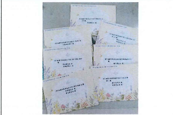
說明：由學校統一寄送給學生家長