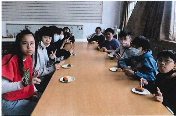
說明:和同學一起享用自製的九層 糕