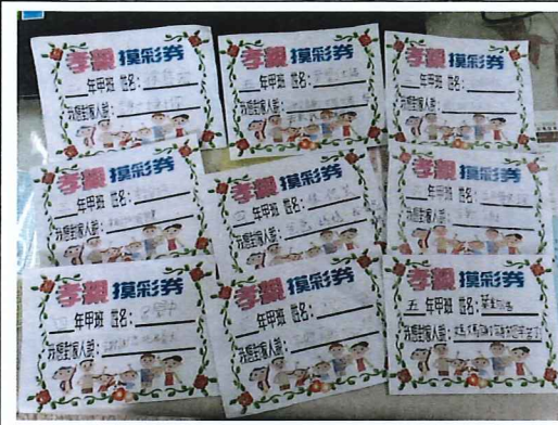
說明：孝親活動摸彩券