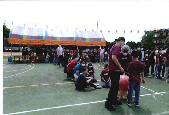
說明：校慶時舉辦親子趣味競賽