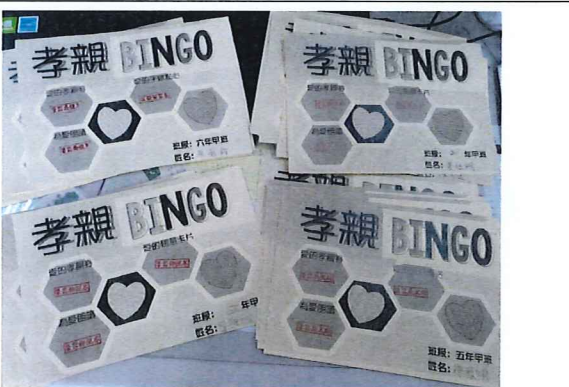
說明：孝親活動集點卡