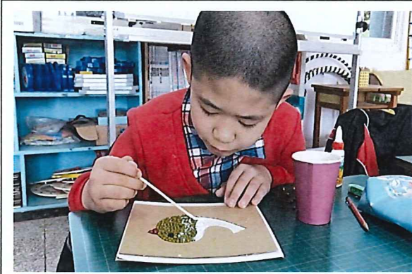
說明：愛的創意孝親卡片製作