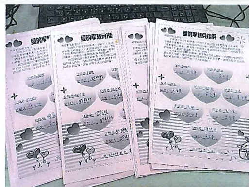
說明：孩子協助家事並認證