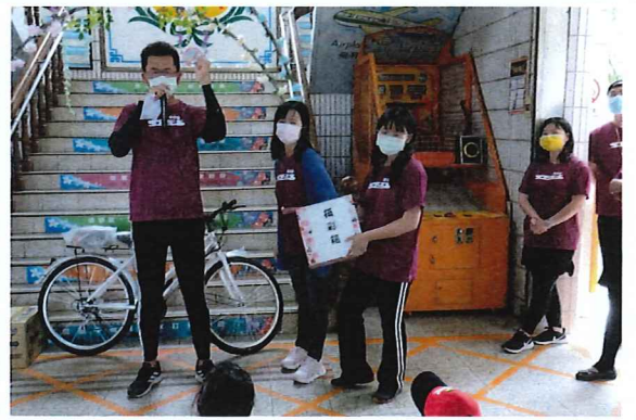
說明：於校慶後進行孝親摸彩活動