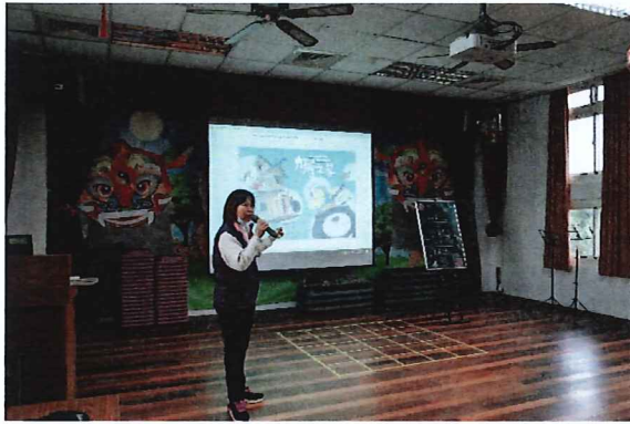
說明：「九層之家」繪本導讀