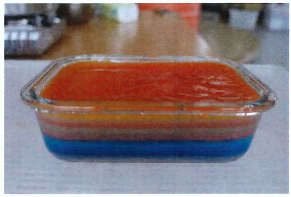
說明: 九層糕大功告成