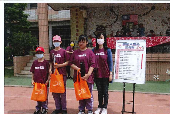
說明：頒發音量前三名同學