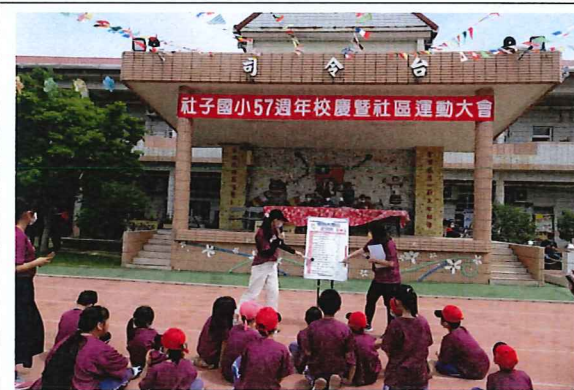
說明：愛的大聲公活動