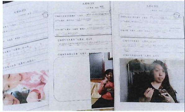
說明:學生將九層糕分享給家人表 達心意後，完成學習單。