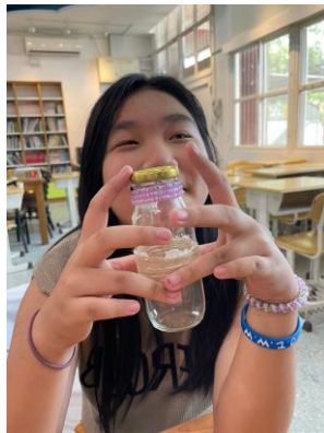
泰雅創客-老師教導孩子廢物利用，讓不要的玻璃瓶搖身一變成為美麗的花瓶。