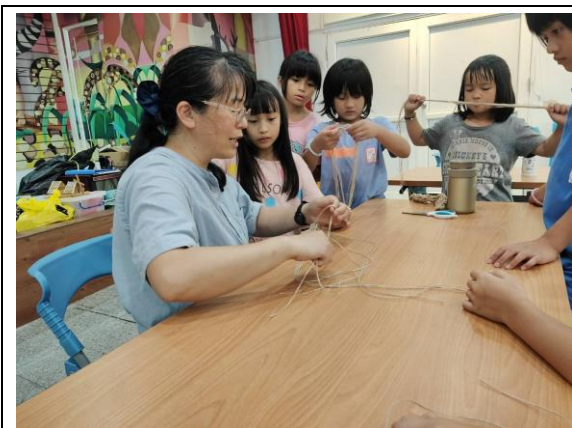
泰雅創意編織-還在們專注聆聽老師的示範，待會兒就要自己動手做。