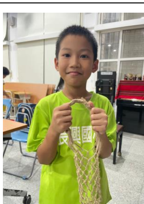
泰雅創意編織-水杯網袋完成了，孩子們喜悅的心情表露無遺。