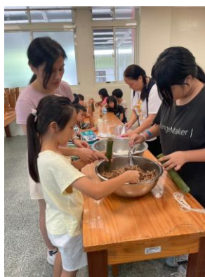
泰雅廚房-老師教導孩子的製作竹筒飯，強調愛物、惜物的精神。