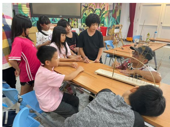
獵人風華再現-部落耆老教導孩子們傳統獵人陷阱製作並加強孩子品德教育。