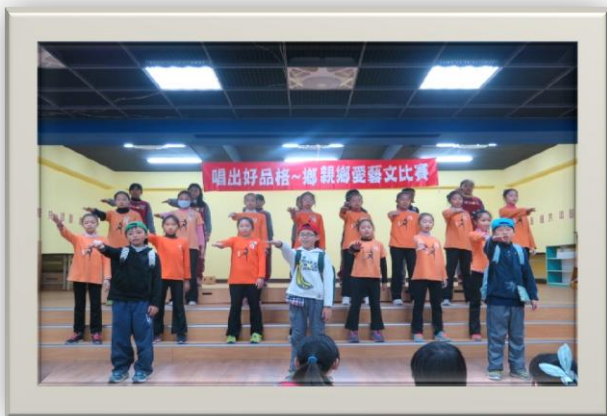
五年級：唱出好品格