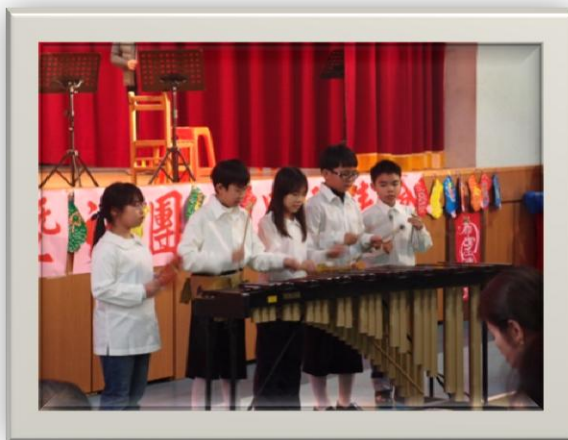
歲末感恩才藝表演