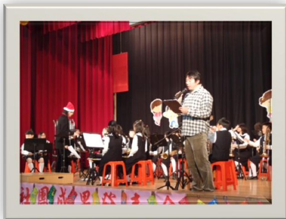
歲末感恩才藝表演