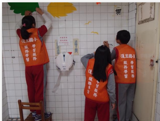
學生參與服務學習