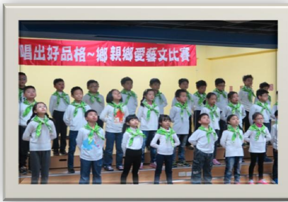
三年級：唱出好品格