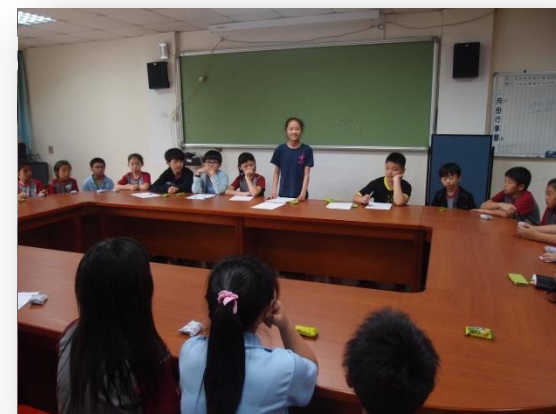
自治市與班長會議