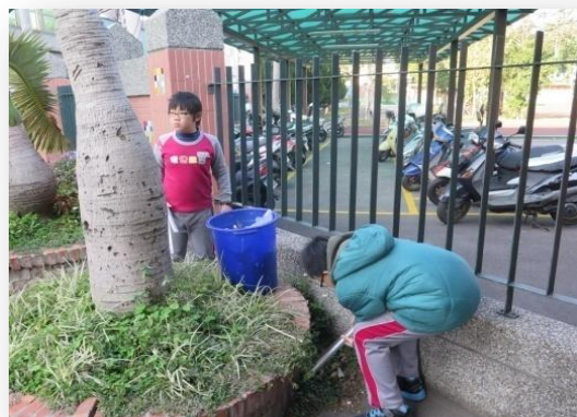
學生參與服務學習