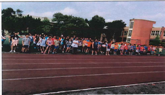
說明:全校在母親節前夕練唱感恩歌曲