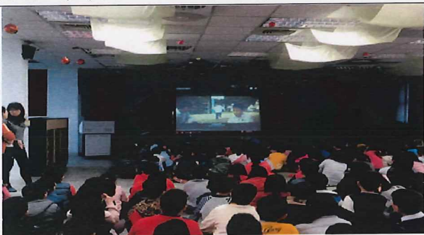
說明:學生分享~蔥花麵包的滋味心得