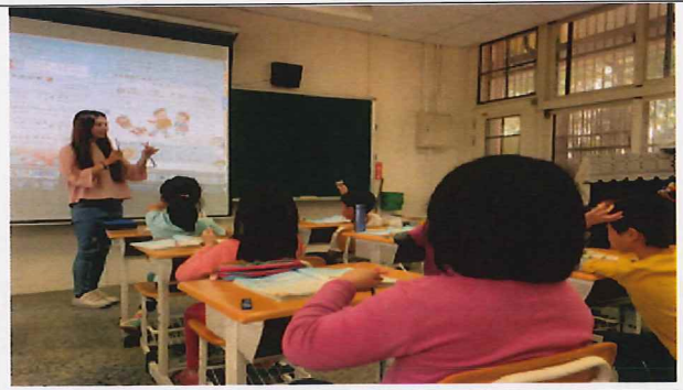
說明:老師上課教唱「幸福的起點」