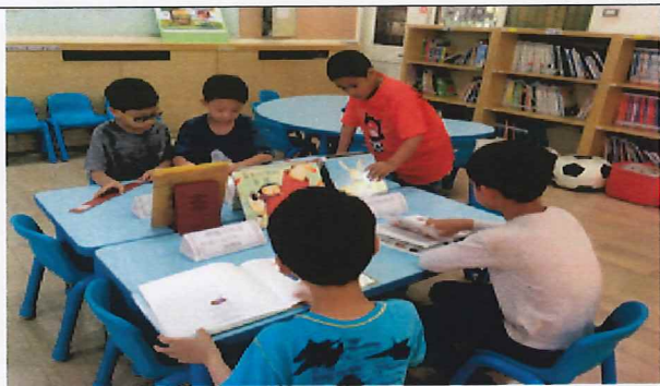
說明:主題書展~感恩的季節