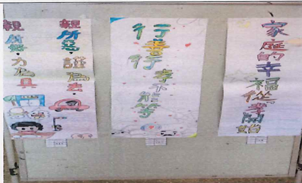
說明:孝親海報標語