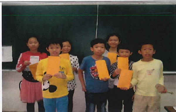
說明:給媽媽的一封信(心中的感謝)