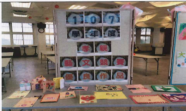
說明:孝親藝文競賽優良作品展