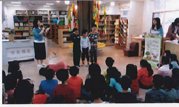
說明:學生踴躍參加主題書展的活動