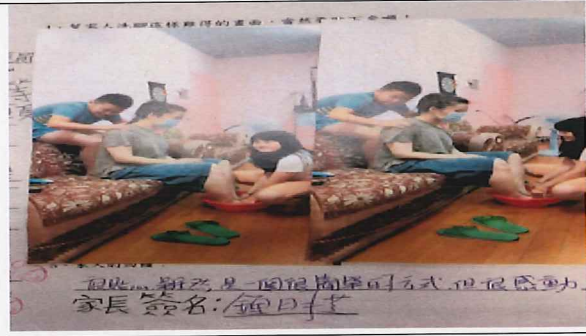
說明:洗腳活動學習單~家長回饋