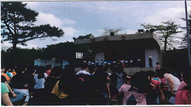
說明:全校師生合唱~幸福的起點