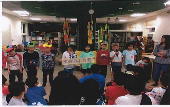
說明:學生分享孝親故事-孝順的小烏鴉