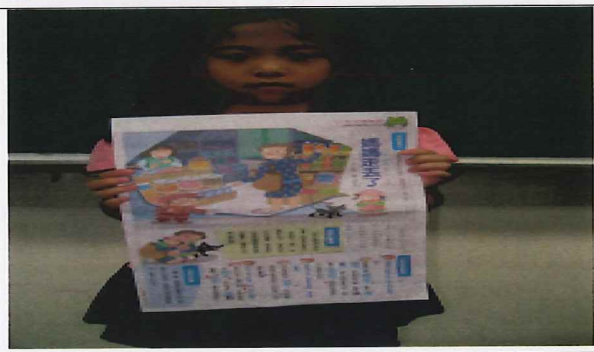
說明:學生分享媽媽辛勤為家庭付出