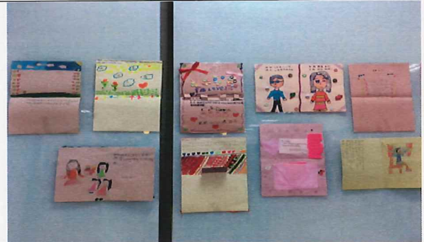
說明:各班優秀作品