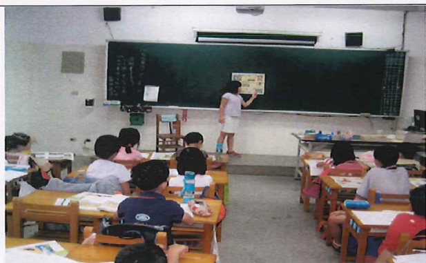
說明:學生朗讀國語日報~媽媽真偉大