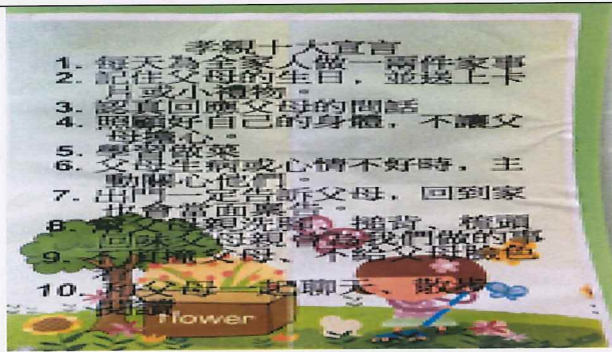
說明:老師與學生討論~孝親十大宣言