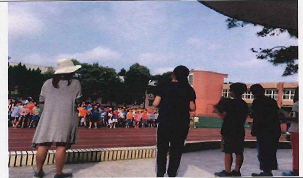
說明:學生上台分享如何孝親