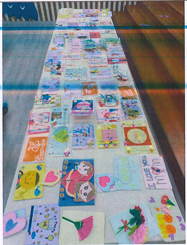
說明：母親節快樂，孝親卡片展示