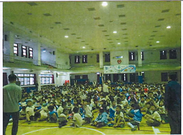
說明：學生熱情參與