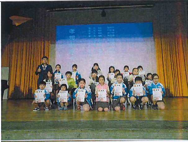
說明：兒童朝會表揚孝親作品競賽得獎學生