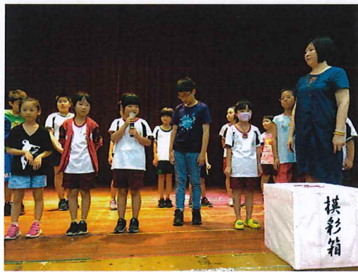
說明：家人的最愛摸彩及分享