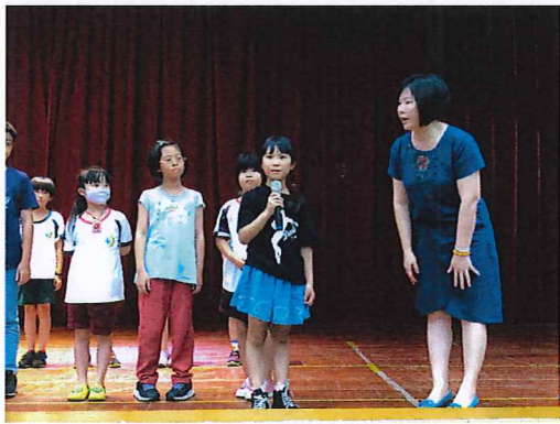
說明：家人的最愛摸彩及分享