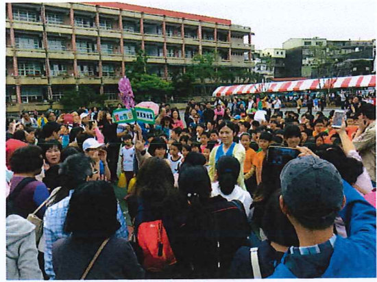
說明：親子三代愛的告白