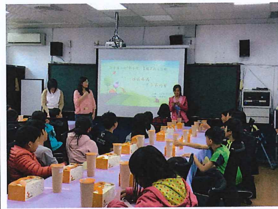
說明：不一樣的媽媽下午茶約會