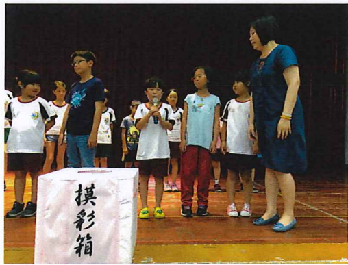
說明：家人的最愛摸彩及分享