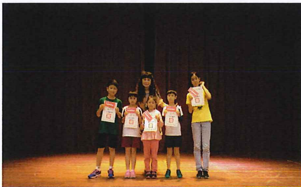
說明：感恩孝親月獲獎者頒獎