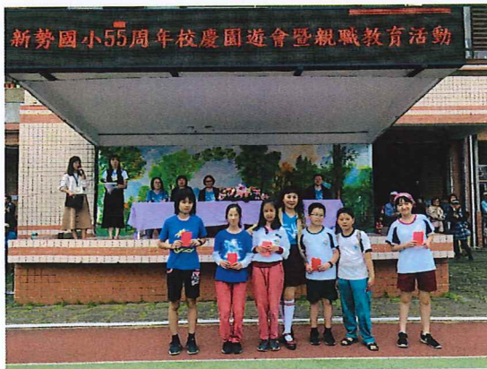
說明：親子三代愛的告白頒獎