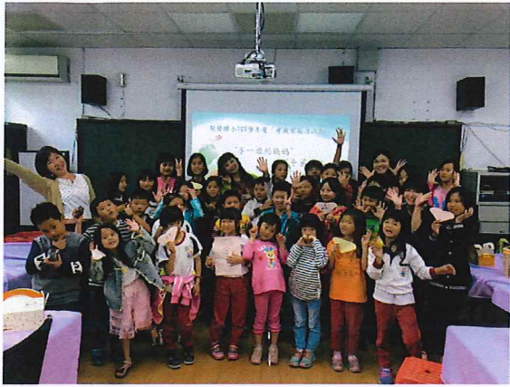
說明：不一樣的媽媽下午茶約會