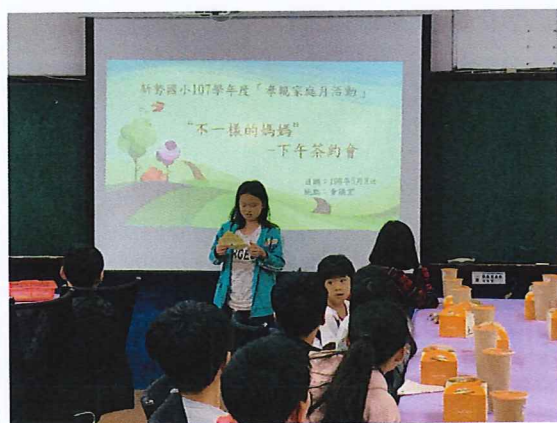
說明：不一樣的媽媽下午茶約會