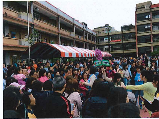
說明：親子三代愛的告白