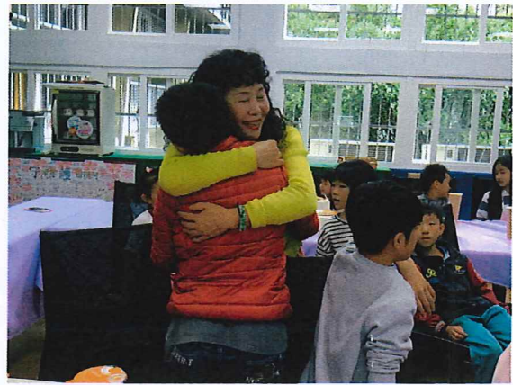
說明：不一樣的媽媽下午茶約會