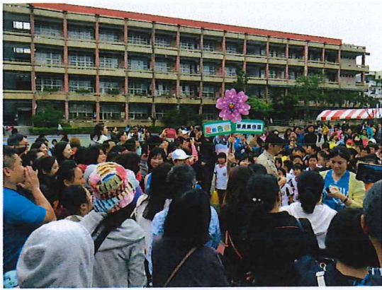
說明：親子三代愛的告白