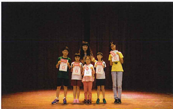
說明：感恩孝親月獲獎者頒獎