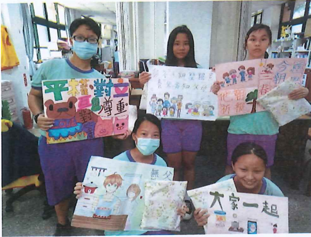
說明：參加創意標語的學生及作品