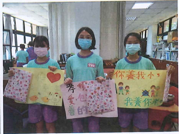
說明：參加創意標語的學生及作品