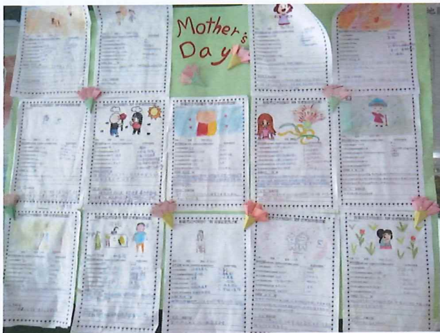
說明：學生書寫孝親感恩學習單