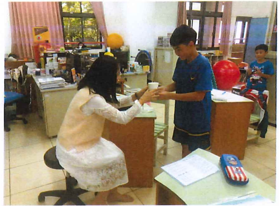
說明：努力學習、練習當個乖順的小孩