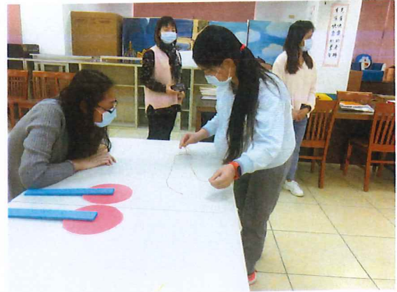
說明：評審媽媽看仔細學生體驗超認真