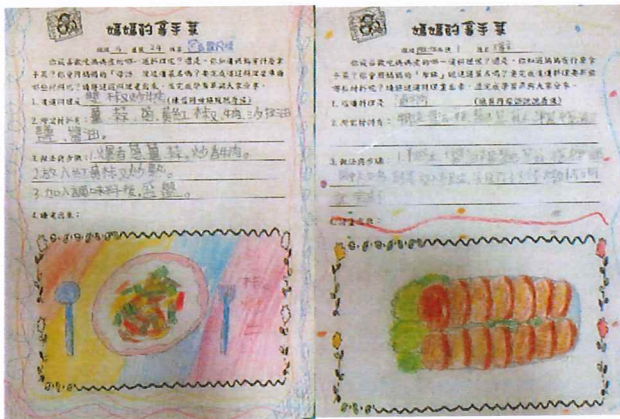
說明：學生分享「媽媽的拿手菜」