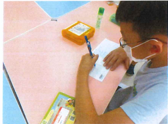
說明：學生認真的把感謝的心意透過明信片表達給長輩