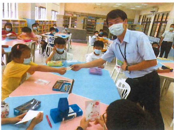
有獎徵答，開心拿到郵局小禮物