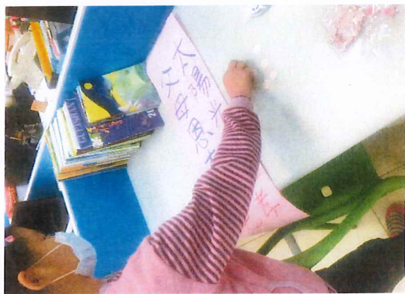
說明：學生製作「愛要大聲說」孝親創意標語