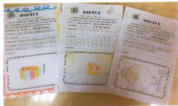
說明：學生用母語說出「媽媽的拿手菜」