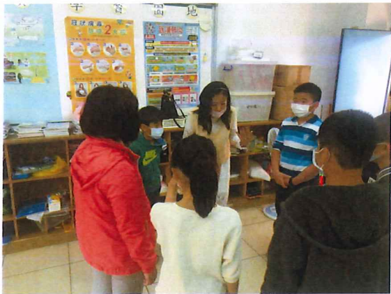
說明：孝親品格訓練營，認真學習孝親行儀