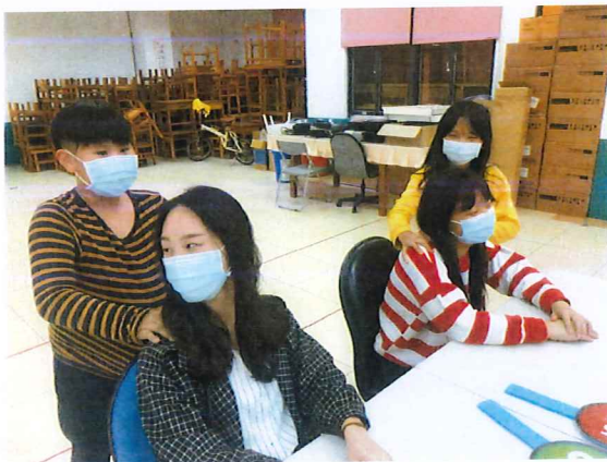
說明：媽媽關主嚴格把關順便紓解疲勞