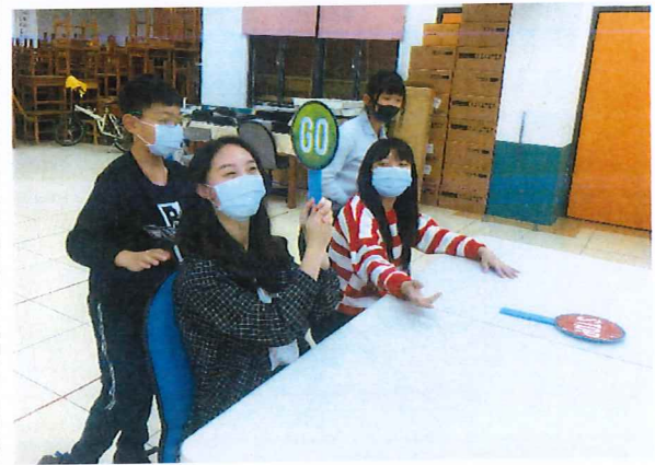
說明：媽媽關主認證的按摩技巧，回家可以幫長輩按摩再加上甜言蜜語