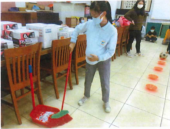
說明：學生體驗挺著大肚子掃地非常不方便