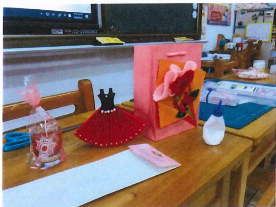
說明：學生製作「愛要大聲說」孝親創意卡片