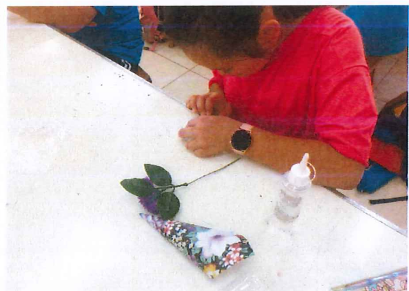
說明：感恩明信片製作，快遞對長輩的愛