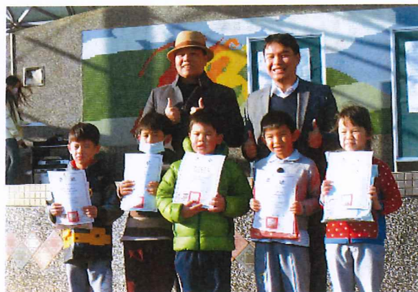
說明：兒童朝會表揚孝親藝文競賽得獎學生