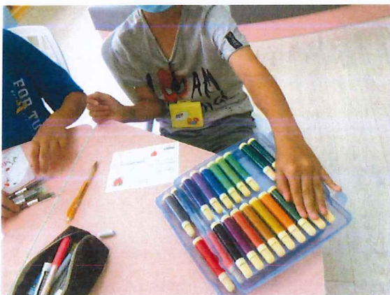
說明：學生設計裝飾孝親明信片