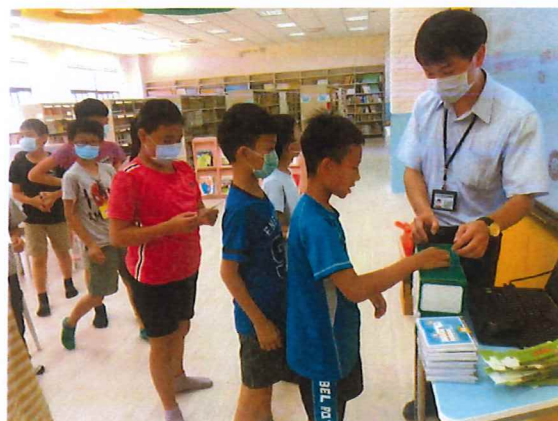
大家很有秩序地排隊，準備寄出愛的明信片