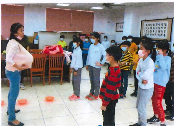
說明：主任示範家事關卡規則