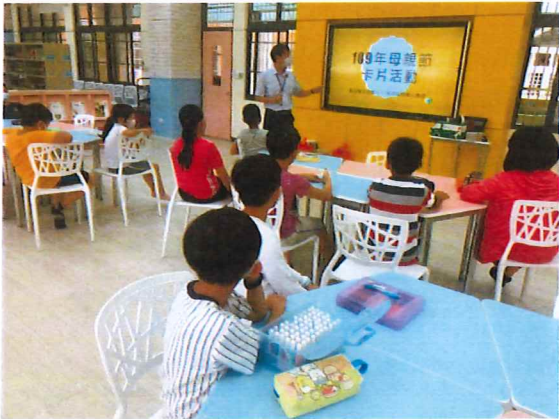
說明：郵局哥哥來教我們完成愛的明信片