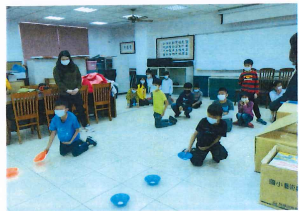
說明：學生挺著「孕肚」認真參與家事體驗活動