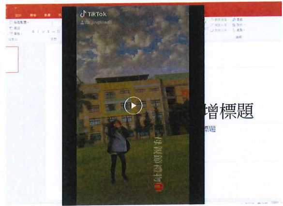
說明：分享與媽媽在家的甜蜜互動，在母親節前夕送給媽媽愛的影片