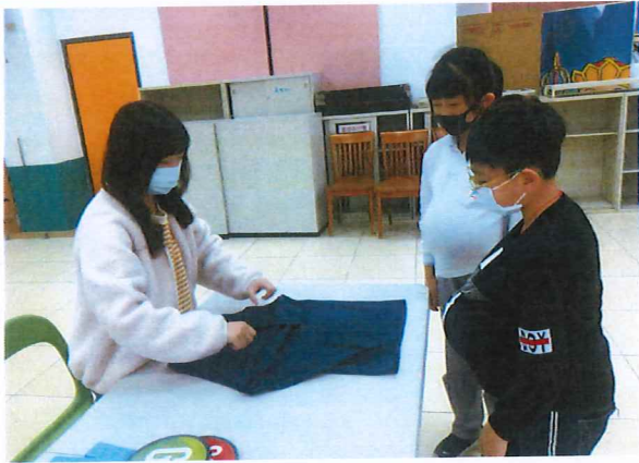
說明：學生仔細聆聽老師教導如何摺衣服