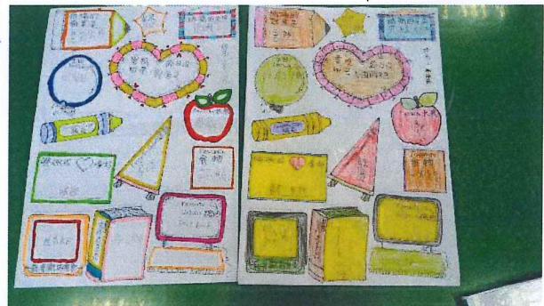
說明：班級孝親活動(訪問媽媽)