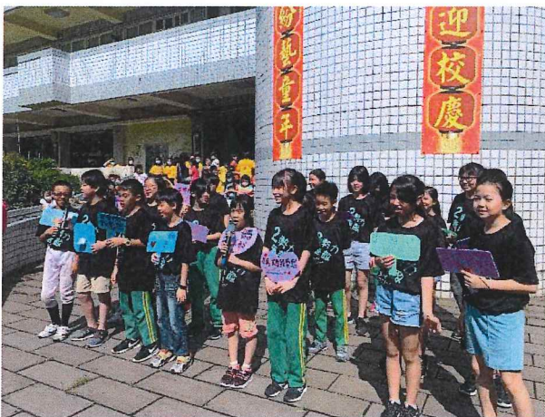
說明:5-2 唱(感謝妳的愛)