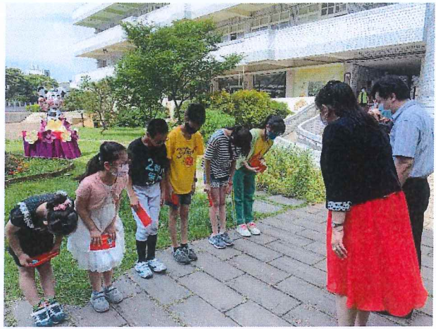
說明：校長頒發愛的禮券。