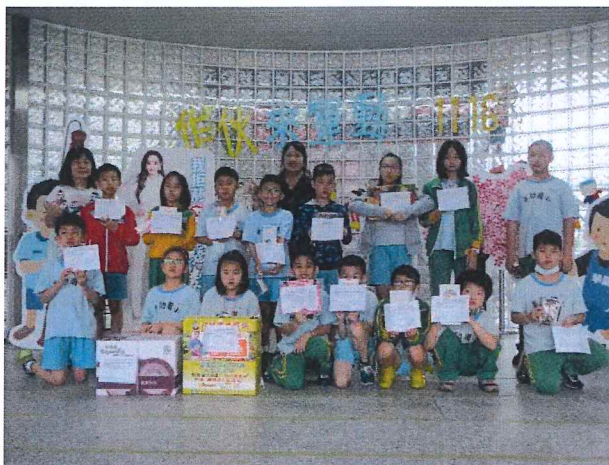
說明：(愛要表現出來)中獎學生