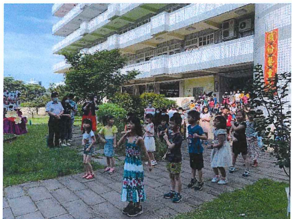
說明:1-1 唱(為我勇敢的媽媽)