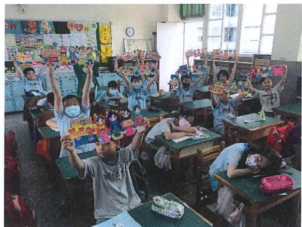
說明：班級孝親活動(母親卡)