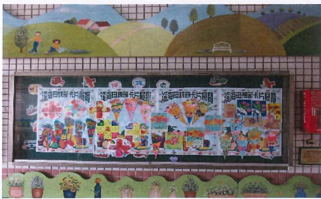
說明：母親節卡片中廊展示