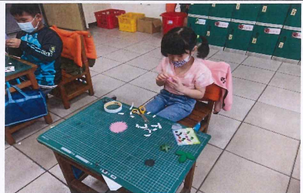
說明：製作母親節卡片與康乃馨