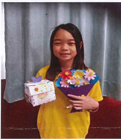
說明：製作母親節卡片與康乃馨