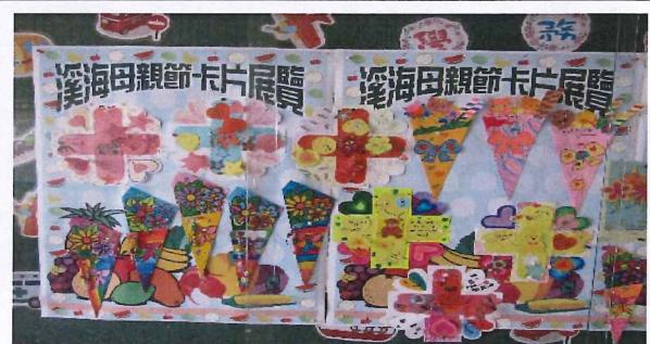
說明：母親節卡片中廊展示