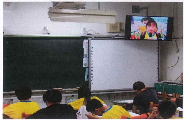
說明：有愛大聲說錄影播出