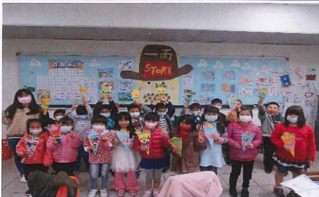
說明：製作母親節卡片與康乃馨