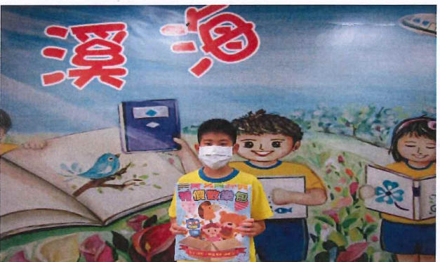
說明：愛的兌換卷抽獎活動