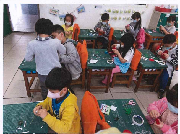
說明：製作母親節卡片與康乃馨