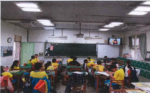
說明：有愛大聲說錄影播出