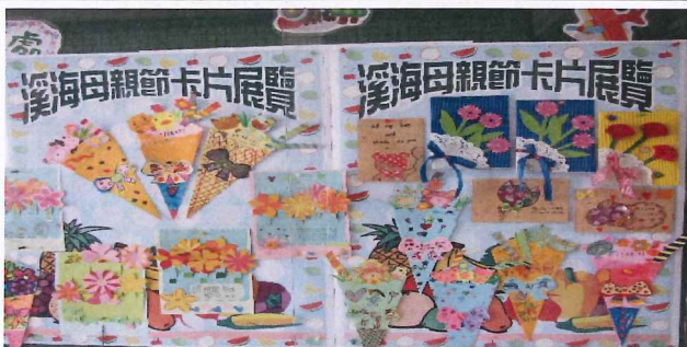
說明：母親節卡片中廊展示