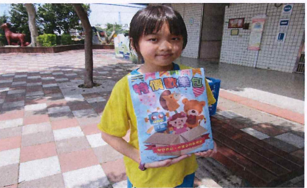
說明：愛的兌換卷抽獎活動