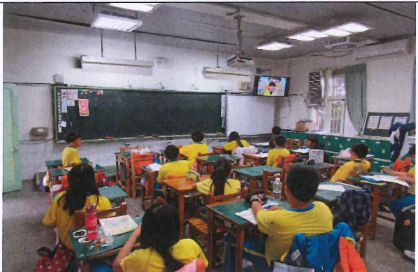
說明：有愛大聲說錄影播出