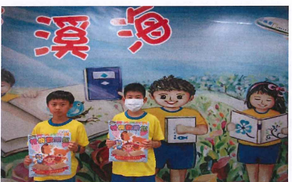
說明：愛的兌換卷抽獎活動