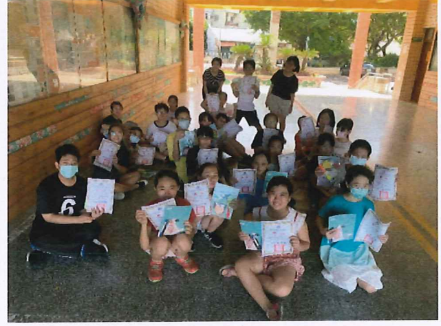
說明：校長頒發獎狀及獎品給優良作品的獲獎學生。