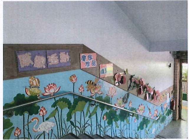
說明：藝文競賽優良作品展示。