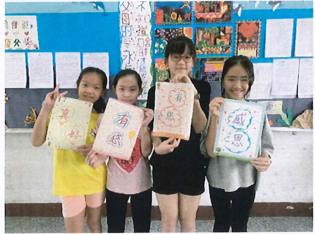
說明：藝文競賽優良作品展示。