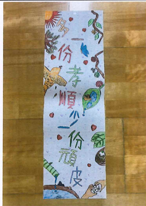
說明：五年級標「心」立意優良作品。