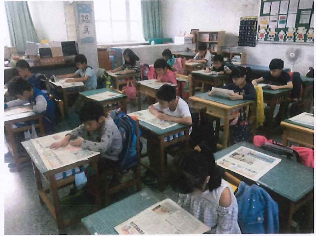
說明：全校學生從國語日報中選讀優良母親節文章，共同閱讀。