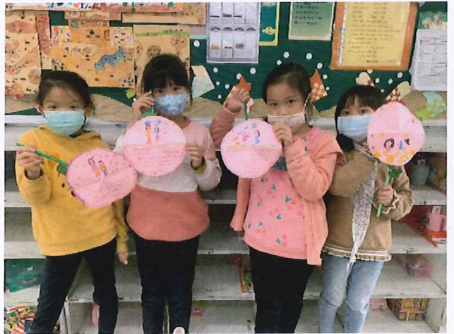
說明：小朋友熱情參與「影」爆真心話活動。