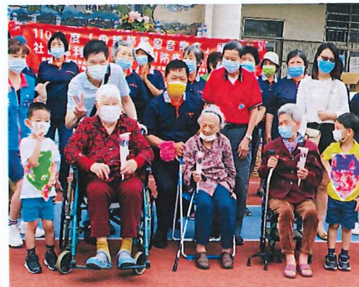
說明:邀請社區最年長的母親一同參與母親節感恩活動