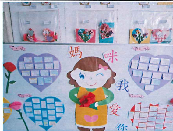
說明:祈福卡與母親卡展示區