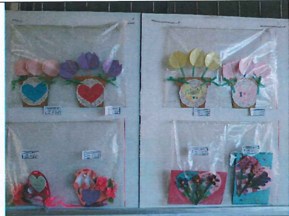
創意美麗的母親卡