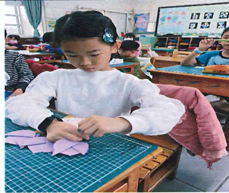
說明:製做立體母親卡