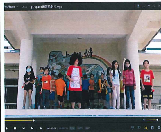
說明:創意有趣的母親節影片