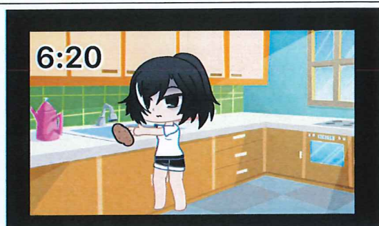
說明:運用軟體製作動畫呈現母親的辛勞