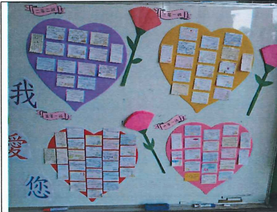
說明:各班的祈福小卡