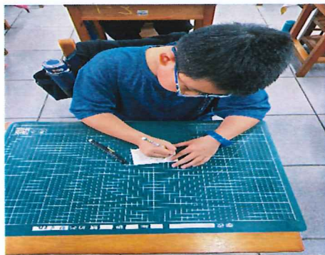
說明:用心寫祈福卡