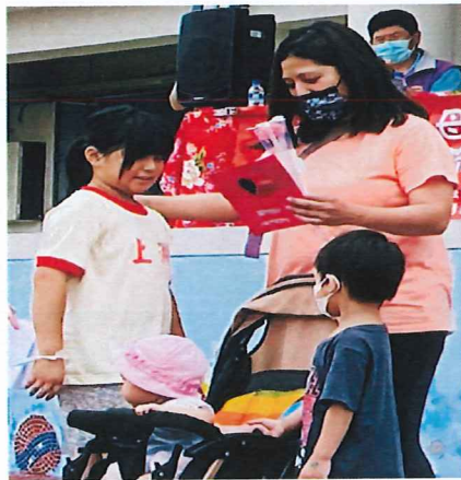
說明:親手致贈母親卡與康乃馨