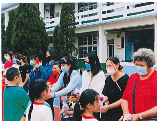
說明:真心的獻上祝福與感謝